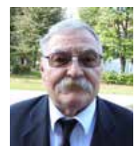
Halász Béla püspök

Áldott, békés, megszentelt húsvéti ünnepet kívánok!