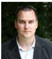
Írta: Halász Dániel lelkipásztor